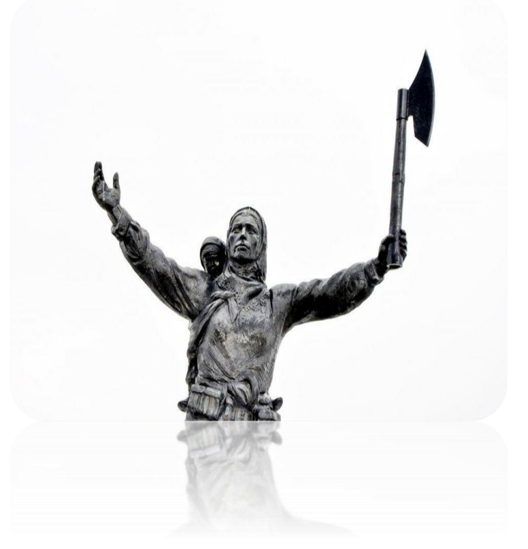
Nene Hatun'un Erzurum Aziziye Parkı'na dikilen heykeli

Cepheye mühimmat taşıyan, askerlere hemşirelik, açılık ve sakalık yapan Nene Hatun, Erzurum'dan sonra tüm Anadolu'da da destanlaştı.